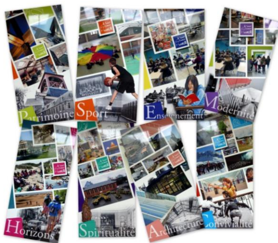
Panneaux placés dans l'impassé des Capucins vers les jardins de l'Hôtel de Ville

Toutes ces informations sont développées sur notre site internet : www.isln.be